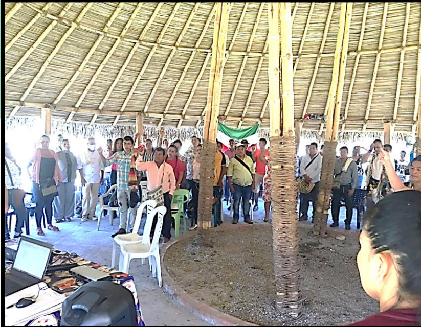
Asamblea ampliada de autoridades 18 de enero 2020.